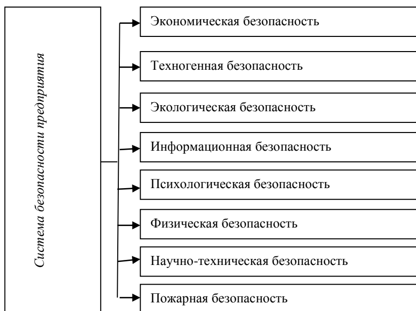
Рис. 2. Система безопасности предприятия

вания от внешних и внутренних угроз, имеющих негативные, прежде всего экономические, а также организационные, правовые и иные последствия».